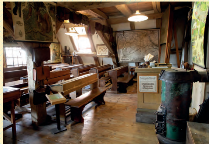
Schulzimmer um 1930

In drei Stockwerken sind überwiegend das ortsansässige Handwerk sowie Bereiche ländlicher Wohn- und Lebenskultur aufbereitet.