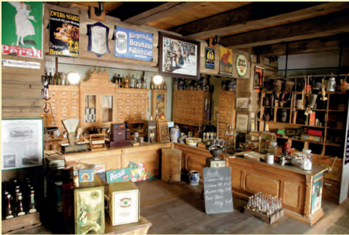
Kaufladen um 1900

Das Heimatmuseum wurde im Jahr 1983 im Salzhaus - einem imposanten Fachwerkbau aus dem 17. Jahrhundert - eröffnet.