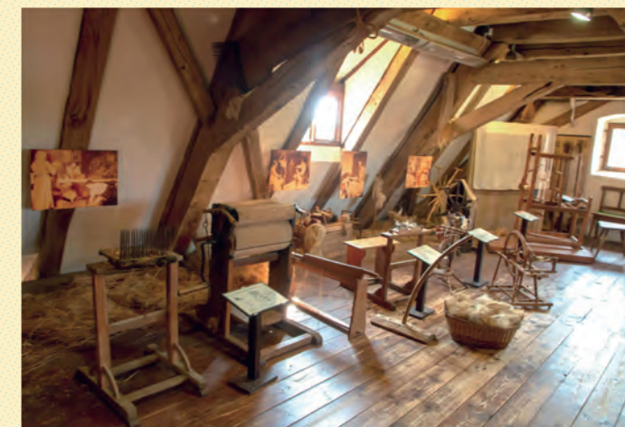
vom Flachs zum Leinen

Dies ermöglicht dem Betrachter, hinter den Ausstellungsstücken den Menschen in seiner oft mühsamen Arbeit zu sehen.