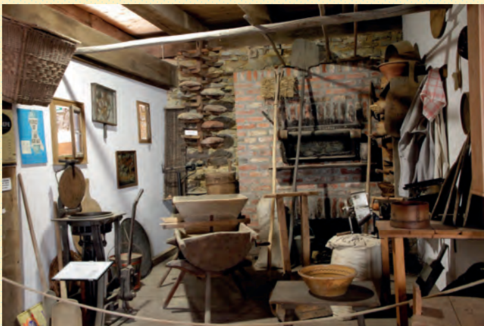
in der Bäckerei

Sämtliche Exponate entstammen dem heimatlichen Raum und ermöglichen so einen Einblick in das Leben eines landwirtschaftlich und handwerklich geprägten Städtchens im 19. und beginnenden 20. Jahrhundert.