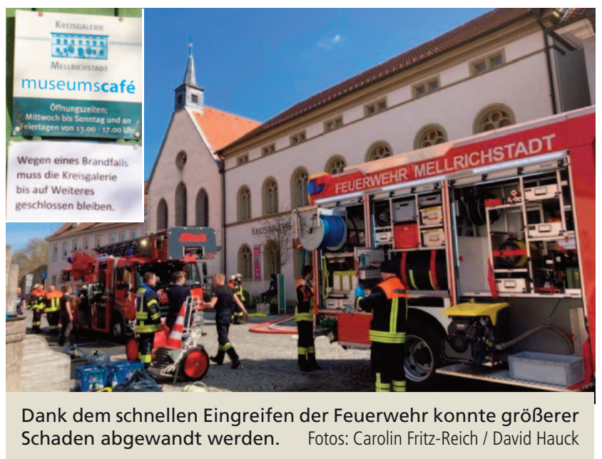
Dank dem schnellen Eingreifen der Feuerwehr konnte größerer Schaden abgewandt werden.

Am Ostermontag, 10. April, entwich gegen Mittag Rauch aus der Kreisgalerie in Mellrichstadt, die derzeit den Großteil der Gemälde des Landkreises Rhön-Grabfeld beherbergt. Ein in Brand geratener Kühlschrank sorgte für große Rauchentwicklung, die das gesamte Gebäude in Mitleidenschaft zog. Die rasch eintreffende Feuerwehr hatte die Lage schnell im Griff und konnte verhindern, dass die Flammen auf die Kunst oder gar das Gebäude übergriffen. Personenschaden entstand zum Glück nicht. Polizei und Feuerwehr gehen von einem technischen Defekt aus. Viele der Kunstobjekte, auch die aktuelle Ausstellung der Künstlerin Sabine Bach sind mit Ruß bedeckt und müssen zunächst fachkundig in Augenschein genommen werden. Die Bezifferung des Schadens kann erst im Nachgang erfolgen. Für den Zeitraum der Reinigung und Wiederherstellung