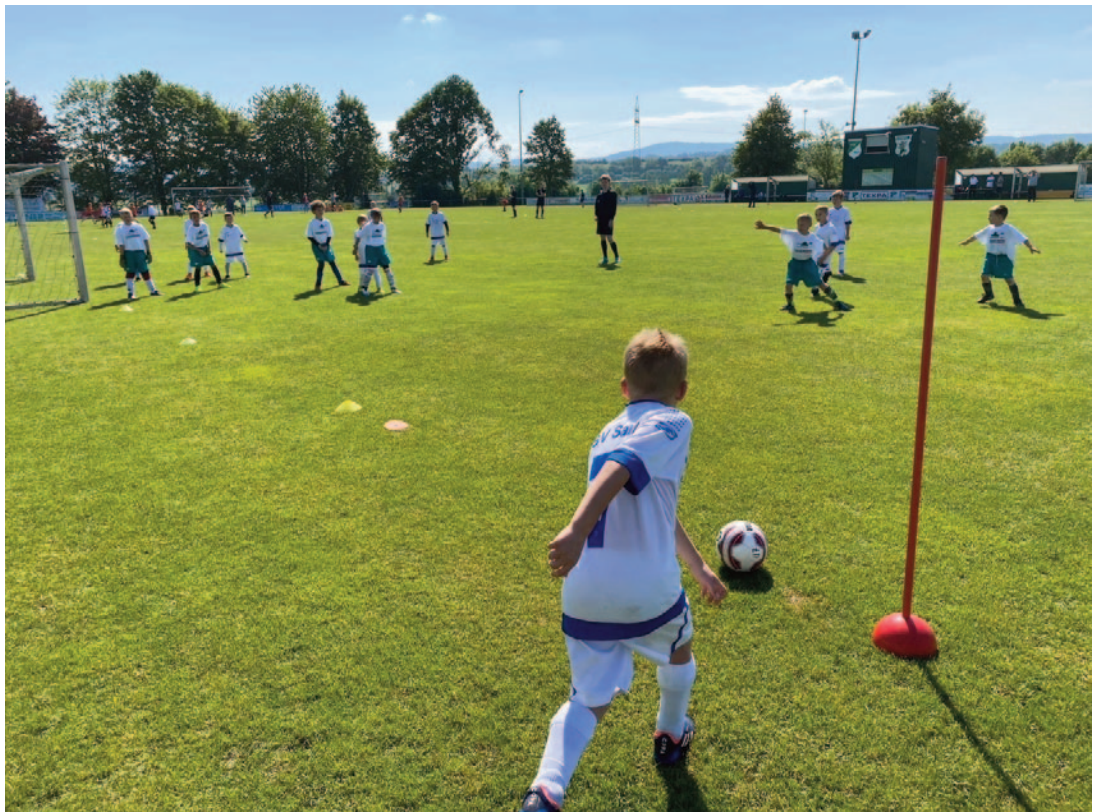
Kicken verbindet: Der Spaß steht während des traditionellen länderübergreifenden Grundschulfußballturniers, wie hier letztes Jahr auf dem Rasen des TSV Großbardorf, im Vordergrund.

Die Attraktivität und der Bekanntheitsgrad des Turniers haben in den letzten Jahren stetig zugenommen. Auch für 2023 konnte sich das Organisationsteam wieder über eine wachsende Zahl an Anmeldungen freuen. Bis auf die beiden Siegerteams des letzten Jahres, die gesetzt waren, entschied das Los über die teilnehmenden Schulen. So werden bei der 15. Auflage des Turniers aus dem Landkreis Rhön-Grabfeld die Grundschule Besengau Bast-